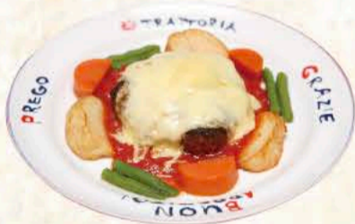
イタリアンハンバーグ

トラトリアハンバーグ 200g・¥1,150 ・300g・¥1,720 Trattoria Sauce Hamburg