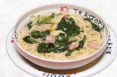
ベーコンホウレン草