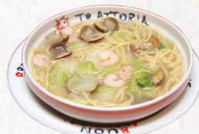
アサリ白菜(小海老入り)

スパゲッティ大盛1.6倍 +¥350(オムレツを除く) Spaghetti extra serve (except Omelet)