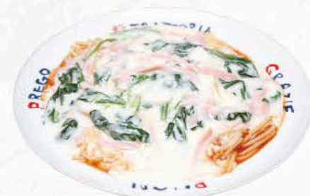
ハムとホウレン草