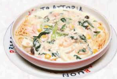
スペシャル(ミックス)