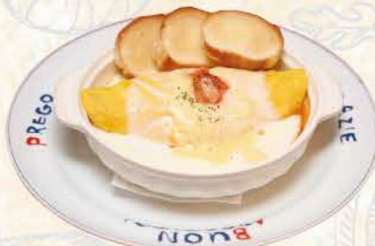
イタリアンオムレツ