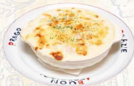
シーフードドリア