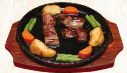
愛鷹牛のサイコロステーキ